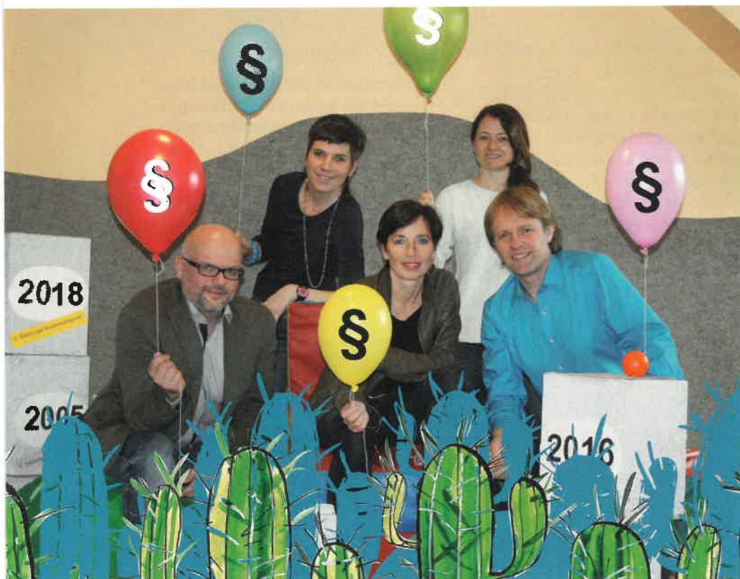
Das Kinderrechtspreis-Team, bestehend aus akzente Salzburg, Verein Spektrum und kija Salzburg, freut sich auf eure Einreichungen.