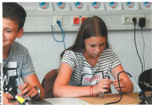
Ganz schön knifflig!

Roboter bauen, die ersten Schritte beim Programmieren wagen, mit einem 3D-Drucker experimentieren und Salzburgs erfolgreichste Firmen der Technik- und IT-Branche kennenlernen: Ein ganz besonderes Sommerferienangebot macht das möglich!