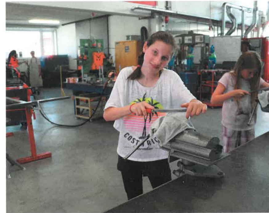
Technik selbst ausprobieren und erleben.