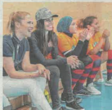
Wörndl und Veith beim Jubeln mit zwei „kick mit“-Mädchen.

Sieg für die VS Liefering 2 Das Abschluss-Turnier wurde